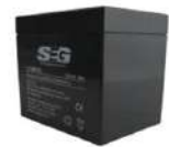
BATERIA 12V 4A SKU C30016