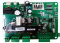
CENTRAL DE COMANDO DOBLE 24V PIVUS 300/250 SKU SGPV300