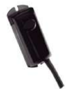
FOTOCELDA INFRA SKU F01643