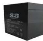
BATERIA 12V 4A SKU C30016